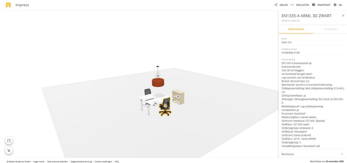
Afbeelding 1 – Weergave van artikelinformatie in PBOX-bestanden

impress ondersteunt nu PBOX-bestanden. Hierdoor zijn artikelinformatie en gerelateerde details, zoals tekst labels, plattegronden en materialen, beschikbaar in impress na het delen vanuit pCon.box en pCon.planner web.