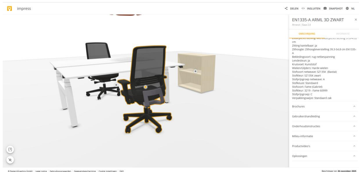
Afbeelding 2 – Weergave van PIM-informatie van PBOX-bestanden

impress ondersteunt nu PBOX-bestanden. Hierdoor is PIM-data beschikbaar in impress nadat deze is gedeeld vanuit pCon.box en pCon.planner web.