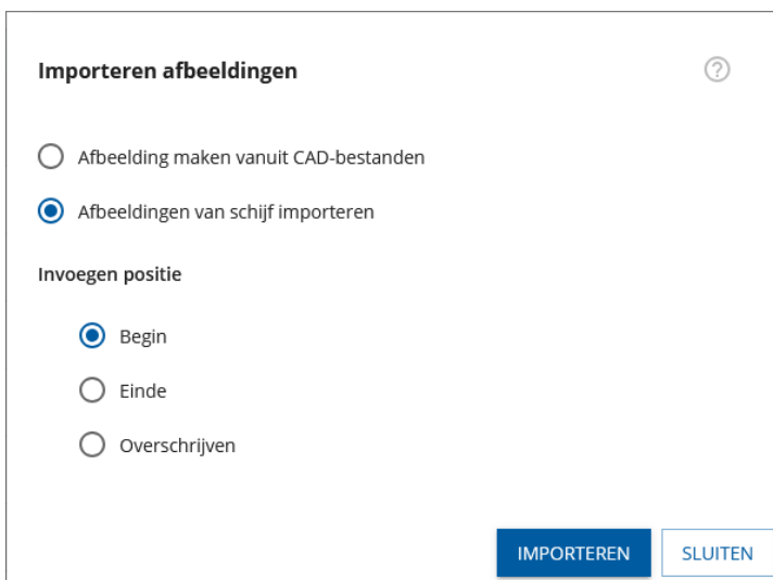
Afbeelding 2 – Dialoogvenster voor het importeren van voorbeeldafbeeldingen